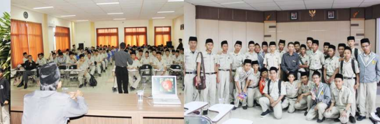
Stadium General di Unair Surabaya