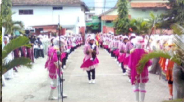
Group Drum Band