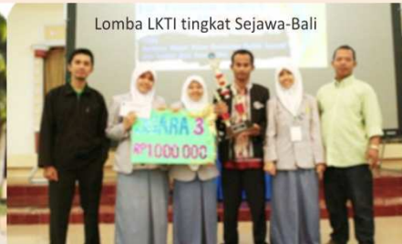
Lomba LKTI tingkat Sejawat-Bali