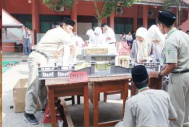
Study Observasi di FKG UGM Yogyakarta