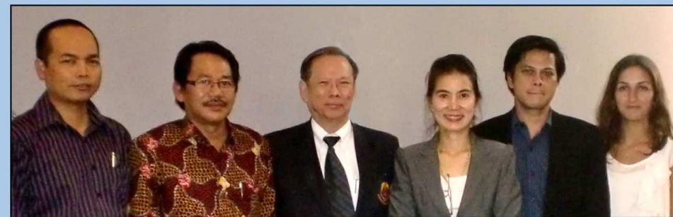
Kunjungan ke Rangsit University of Thailand