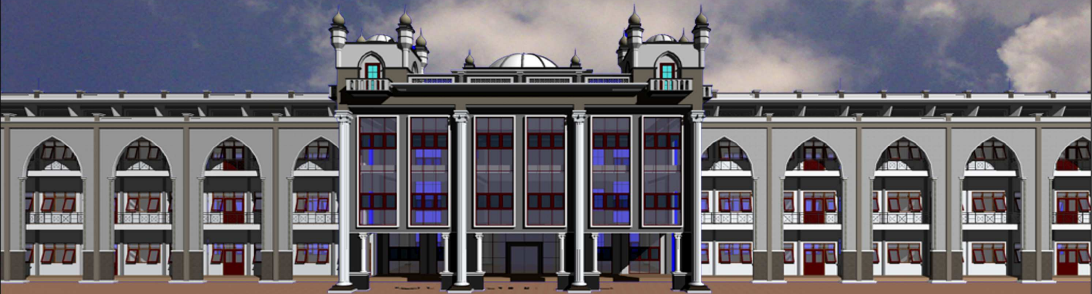
Master plan Gedung SMA Darul Ulum 2 Unggulan BPPT Jombang